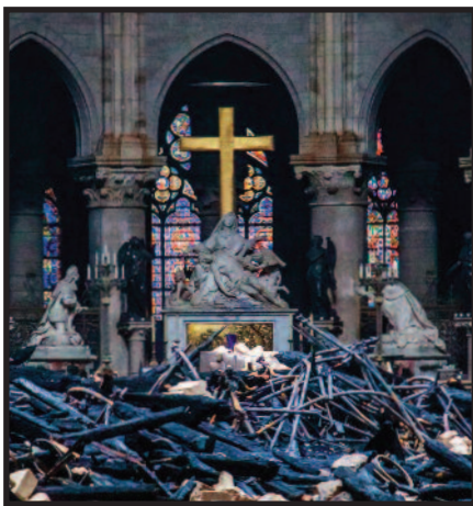
Gaisras Paryžiaus Dievo Motinos katedroje – didžiulė pasaulio netektis – 9 psl.