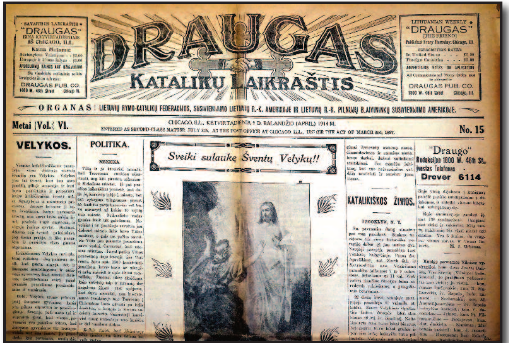
1914 metų velykinis numeris (balandžio 9 d.) – tuomet „Draugui“ nebuvo nė penkerių...

Mieli skaitytojai, „Draugas“ jus šiandien sveikina taip pat, kaip ir prieš daugiau nei šimtmetį: „Sveiki sulaukę Šventų Velykų“.